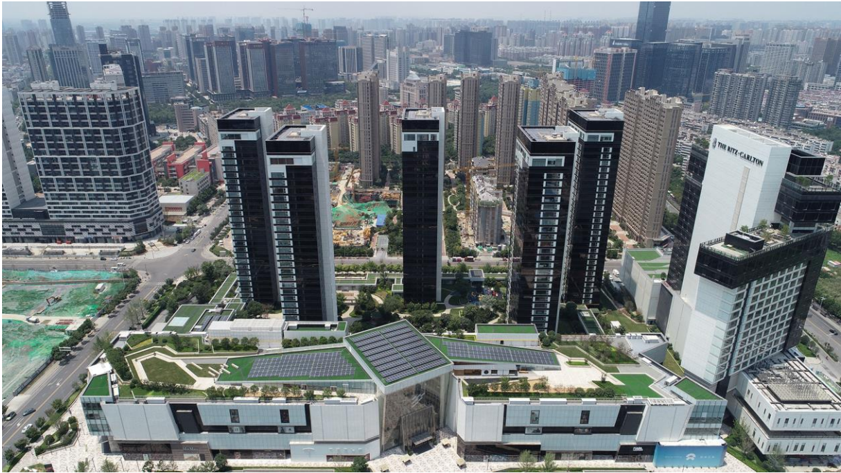
Abbildung 1 - Großprojekt "International the CITY" abgedichtet von KÖSTER aus Ostfriesland